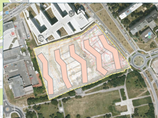
▲ Situační plán původního schváleného konceptu Site plan of the original, approved concept