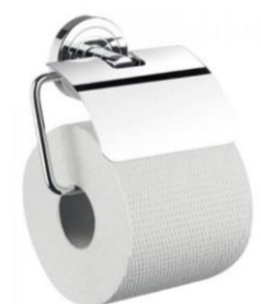
držák toaletního papíru chrom