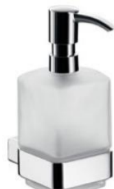
dávkovač mýdla chrom / sklo