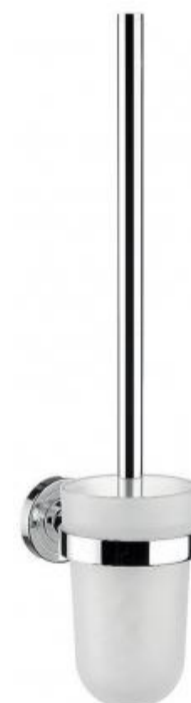
WC štětka chrom / sklo