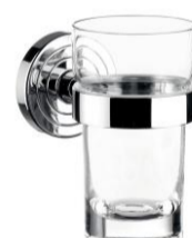
sklenička chrom / sklo