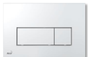
Alca Plast 571 Chrom lesk Příplatek: 325 Kč