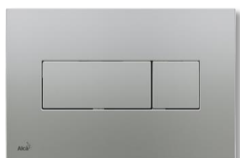
Alca Plast M372 Chrom mat Příplatek: 1.129 Kč