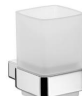
sklenička chrom / sklo