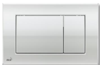
Alca Plast M271