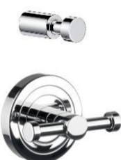
háček / dvojháček chrom