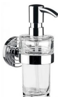
dávkovač mýdla chrom / sklo