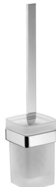
wc štětka chrom / sklo