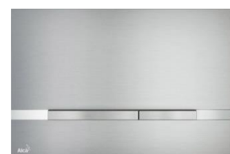
Alca Plast Stripe Nerez Příplatek: 3.278 Kč

Uvedené částky jsou bez DPH. | Uvedené údaje a vyobrazení mají pouze informativní charakter a CENTRAL GROUP si vyhrazuje právo na změny.