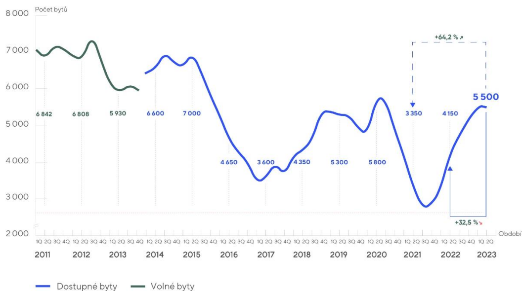
Graf – Vývoj nabídky nových bytů v Praze 2011–2023

Pozn: 1Q 2014 došlo ke změně metodiky. Nabídka se namísto volnými byty začala definovat byty dostupnými (volné + rezervované) Zdroj: Trigema (2012–2016) Trigema, Skanska Reality, Central Group (2017–2023)