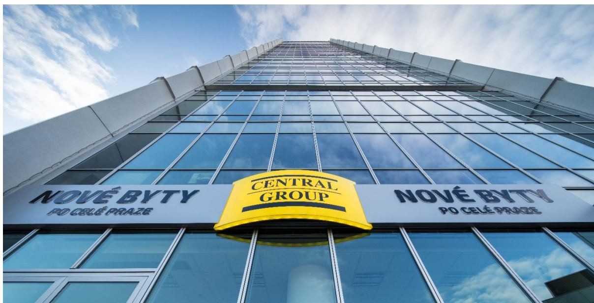
Sídlo Central Group na Pankráci

Praha, 29. ledna 2021 – Ačkoli prognóza ministerstva financí letos počítá s růstem nezaměstnanosti z loňských 2,6 procenta na 3,3 procenta, některé firmy místo propouštění nabírají nové zaměstnance. Velký personální nábor v lednu vyhlásil největší český rezidenční stavitel Central Group, který dlouhodobě drží pětinový podíl na trhu nového bydlení v Praze. Růst společnosti souvisí s rekordním množstvím nových projektů, které v metropoli připravuje. Nemovitostní trh se díky nim rozšíří o tisíce nových bytů.