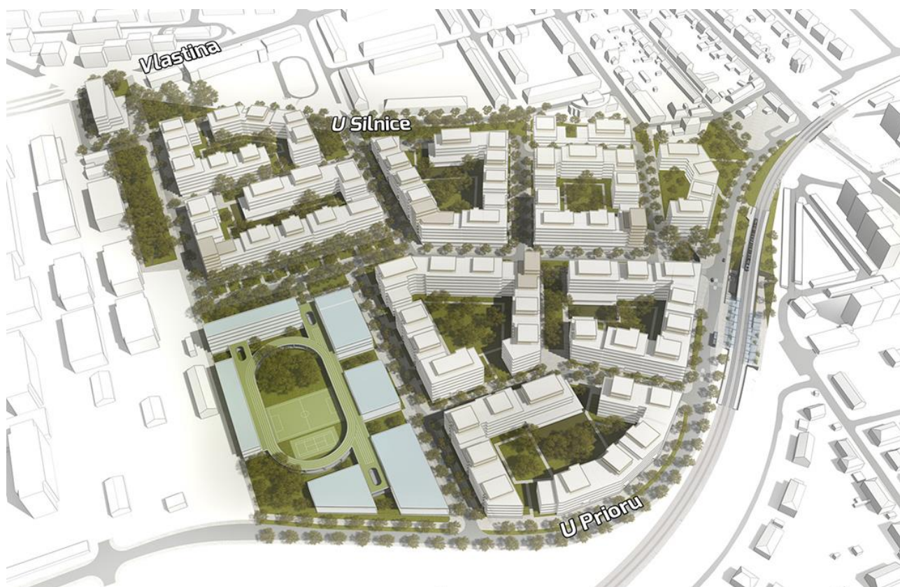
Připravovaná nová rezidenční čtvrť na místě stávajícího průmyslového areálu Westpoint v Praze 6

V rámci pořádaných architektonických workshopů investor přímo oslovuje vybrané architektonické ateliéry, které pak v případě zájmu o účast předkládají své návrhy na ztvárnění staveb v lokalitě, za což jim investor hradí stanovené skicovné. Vedle toho se do workshopu mohou volně přihlásit i další architektonické ateliéry.