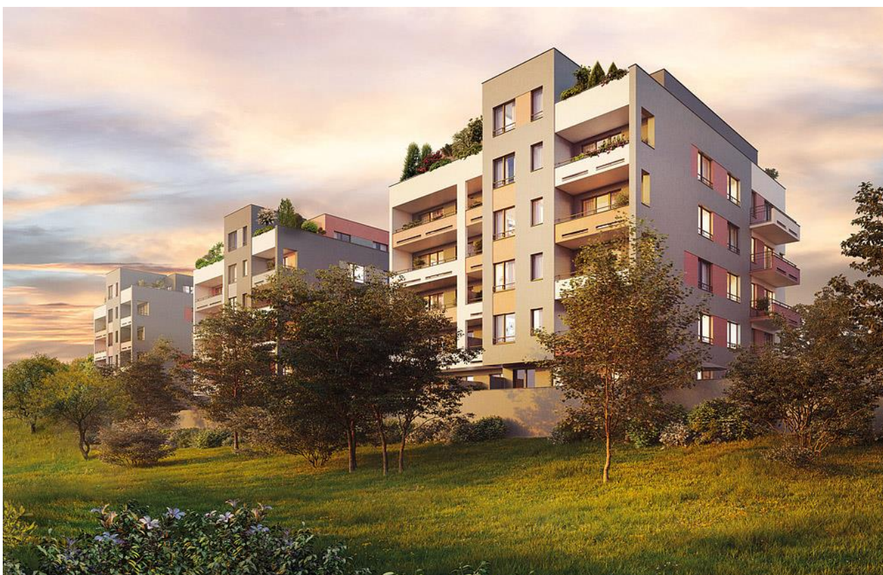
Zahrady Bohdalec nabízejí klidné bydlení v blízkosti Hamerského rybníka

Praha, 8. 12. 2020 – Velká poptávka po novém bydlení, nedostatečná nabídka v důsledku pomalého povolování a vnímání koupě nemovitosti jako investice do budoucna. Kombinace těchto faktorů vede v hlavním městě k tomu, že se většina rezidenčních projektů prodá ještě před dokončením. Vyplývá to ze zkušeností největšího rezidenčního stavitele Central Group.