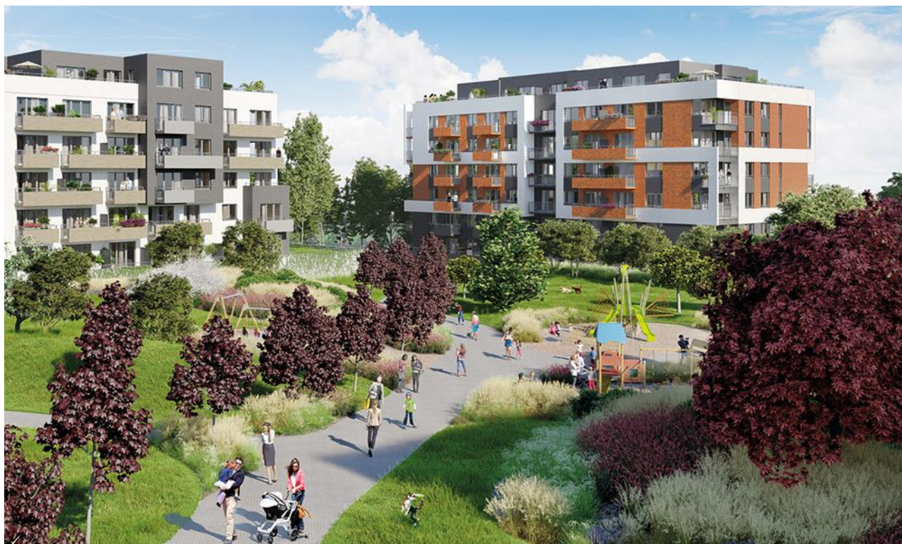
Park Zličín je ideálním místem pro klidné bydlení