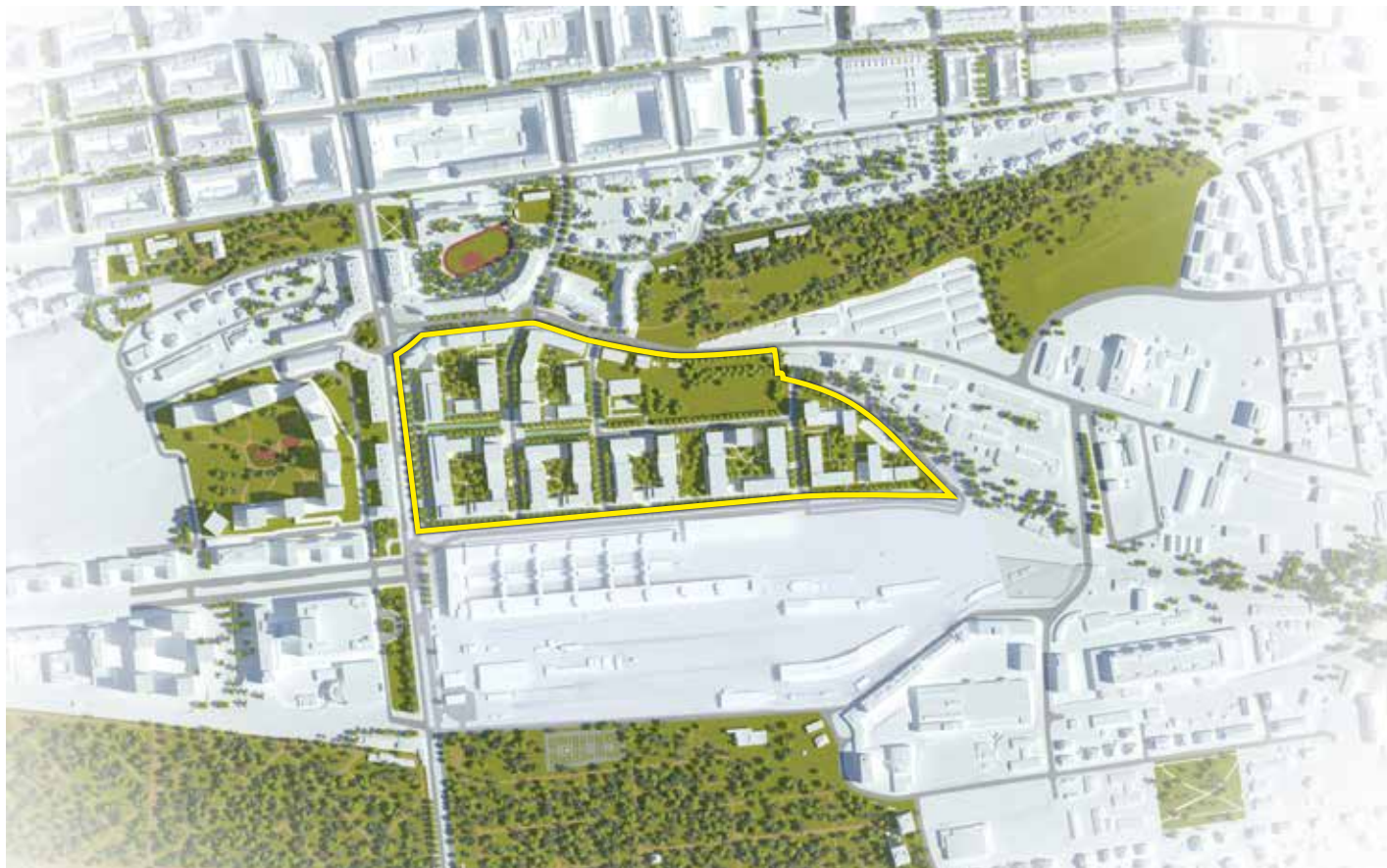
Schéma – zastavitelná plocha a park Diagram – built-up area and park

The plan of CENTRAL GROUP is to transform the area into the new residential PARKOVÁ ČTVRŤ